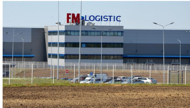
Логистический комплекс FM Logistic