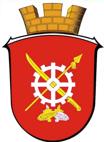
Герб и флаг Аксая