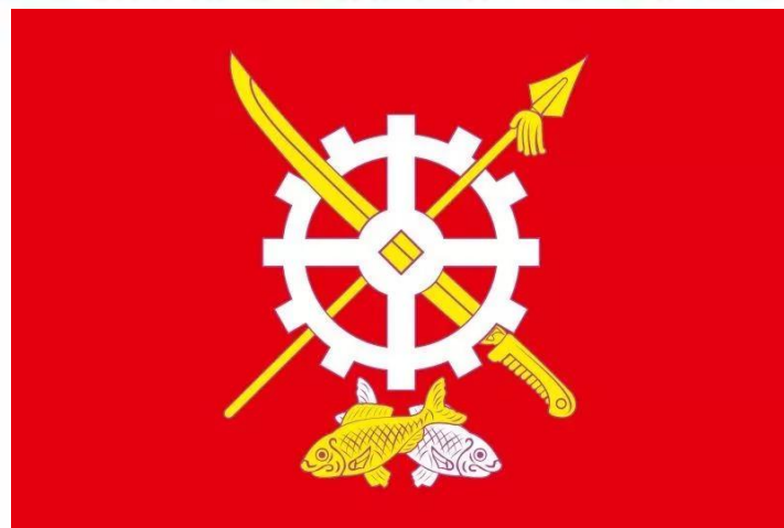
Герб и флаг Аксайского района