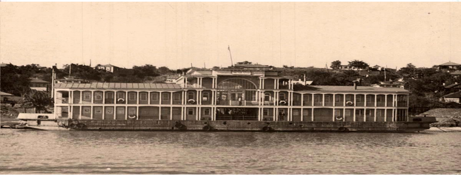
Пристань на реке Дон, 1970 год

В городе имеется пристань на реке Дон, железнодорожная станция, через Аксай проходит объездная автомобильная магистраль, огибающая с востока Ростов-на-Дону.